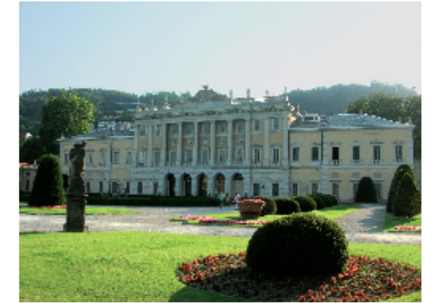
Como, Villa Olmo (sec. XVIII). Elementi lapidei in pietra di Viggù e di Saltrio