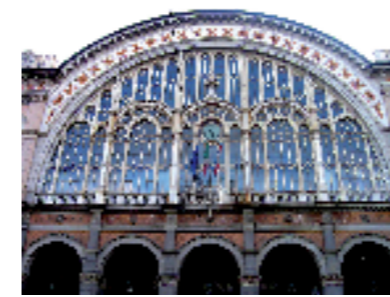
Torino, Stazione di Porta Nuova (sec. XIX). Facciata in pietra di Viggù