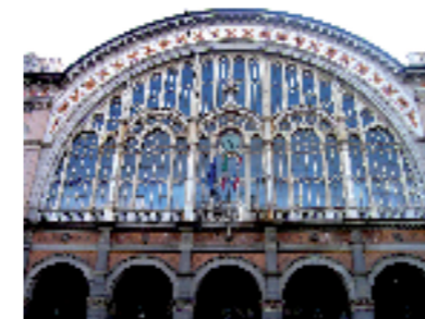
Torino, Stazione di Porta Nuova (sec. XIX). Facciata in pietra di Viggù