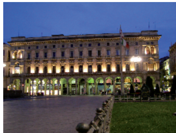
Milano, Piazza del Duomo. Portici settentrionali, (1870) in pietra di Viggù