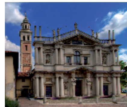
Saronno, Santuario della Beata Vergine dei Miracoli (sec. XVI). Facciata in pietra di Viggù e di Brenno, tiburio, in pietra di Saltrio