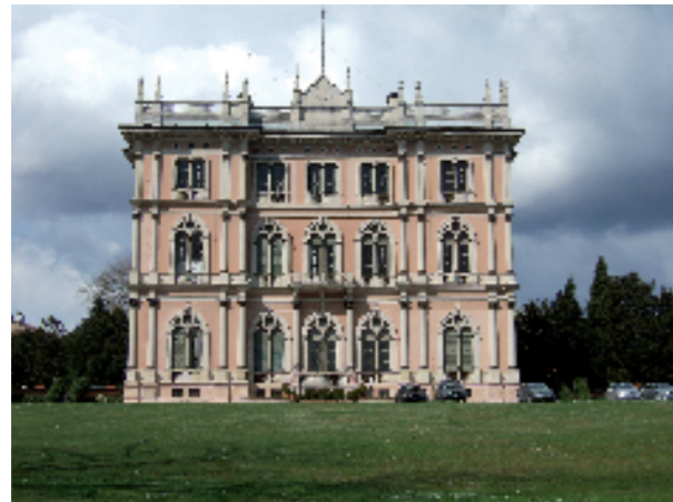
Varese, Villa Andrea Ponti, (sec. XIX). Elementi lapidei in pietra di Viggù

In questo quadro vengono presentate le fotografie di alcune delle opere più importanti eseguite con le pietre cavate dalle cave di Brenno Useria, Saltrio e Viggù, con la partecipazione diretta delle ditte e della mano d'opera locale.