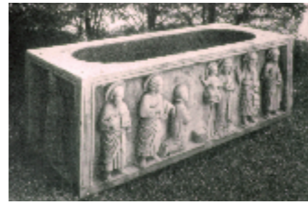
Vertemate, Abbazia Cistercense di San Giovanni Battista. Sarcofago in pietra di Viggù (sec. XII ?)