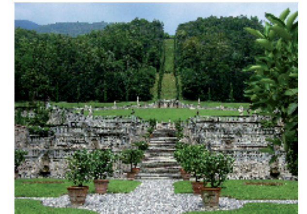
Casalzuigno (VA) Villa Della Porta Bozzolo (sec. XVIII). Giardino, balaustre in pietra di Viggù