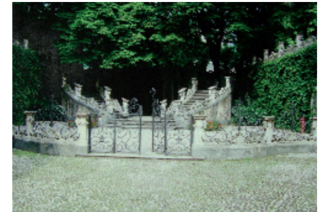
Como, Palazzo Giovo (sec. XVIII). Giardini con scaloni e balaustre in pietra di Saltrio