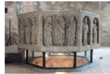
Varese, Battistero di San Giovanni, fonte battesimale, (sec. XIV), in pietra di Viggù