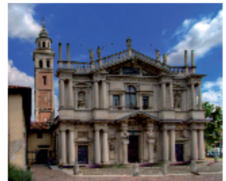
Saronno, Santuario della Beata Vergine dei Miracoli (sec. XVI). Facciata in pietra di Viggù e di Brenno, tiburio, in pietra di Saltrio