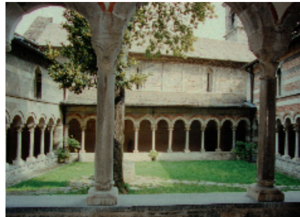
Abbazia di Piona (sec. XIII), chiostro: basi delle colonne e due colonne pietra di Viggù con capitelli e base degli archi in pietra di Saltrio