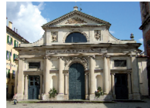
Varese, Basilica di San Vittore. Facciata (sec. XVIII) in pietra di Viggù