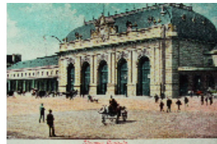
Milano, vecchio edificio della Stazione centrale, (sec. XIX). Facciata e paramenti interni in pietra di Viggù