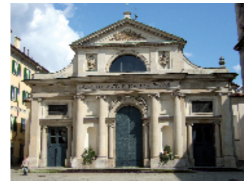
Varese, Basilica di San Vittore. Facciata (sec. XVIII) in pietra di Viggù