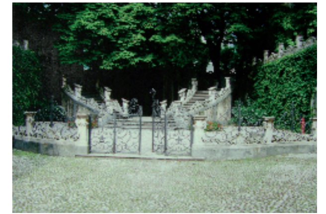
Como, Palazzo Giovo (sec. XVIII). Giardini con scaloni e balaustre in pietra di Saltrio